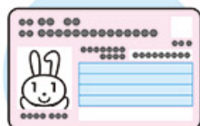
マイナンバーカード